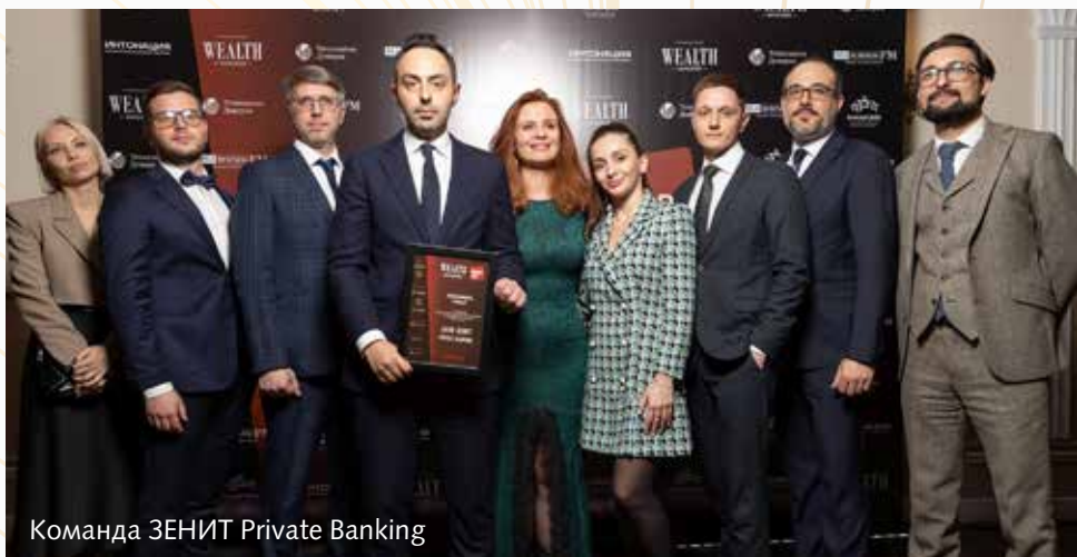
Команда ЗЕНИТ Private Banking

А ранее жюри премии DIGITAL LEADERS AWARD 2022 наградило банк за ресторанный карту Restocard ЗЕНИТ Private Banking в номинации «Продукт года». Награда присуждается за наиболее интересные рыночные практики, проекты и инновации. Уникальность продукта — в том, что держателям обеспечены кешбэк до 10% в ресторанах, барах и кафе по всему миру, а также возможность бронирования столиков в приоритетном порядке. Еще один плюс — скидки от партнеров банка, которые доходят до 30%. Карта бесплатна в обслуживании, а на остаток средств, хранящихся на счете, организация начисляет до 7% годовых.