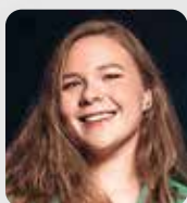
Текст ДАРИЯ НОВИКОВА, ОБОЗРЕВАТЕЛЬ «Б.О.»

Премиальная программа отечественной платежной системы «МИР» — MIR Supreme — включает в себя различные бонусы и выгоды для комфортной жизни клиентов. В первую очередь это возможность пользоваться Mir Pass — сервисом доступа в бизнес-залы на территории аэропортов и железнодорожных вокзалов. До 2022 года наиболее известными в России сервисами в этом направлении были Priority Pass и Lounge Key, но, как и пара самых популярных МПС, они заявили об остановке работы в стране. «МИР» представила освободившемуся рынку достойную альтернативу уже в декабре 2022 года.