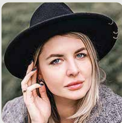
Ирина Анисина, фотограф

Черный цвет — беспроигрышный вариант, тканевая фактура удачно подчеркивает статус. Повторное упоминание премиального бренда SUPREME (вверху) в этом случае считаю уместным, т.к. не мешает восприятию дизайна и работает на повышение статуса малоизвестного банка