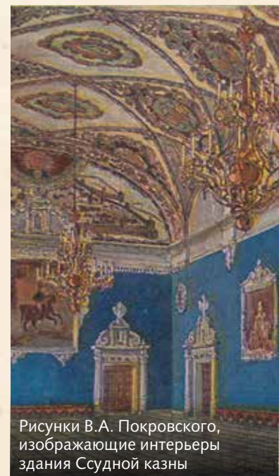
Рисунки В.А. Покровского, изображающие интерьеры здания Ссудной казны