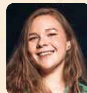
Текст ДАРИЯ НОВИКОВА, ОБОЗРЕВАТЕЛЬ «Б.О.»

В центре Москвы, в Настасьинском переулке, расположилось величественное здание Ссудной казны. За привлекательным фасадом скрываются богатая история, яркие росписи аукционного зала, а под ними — неожиданно неприглядные современные офисные перегородки. Но так было не всегда, и скоро все может измениться