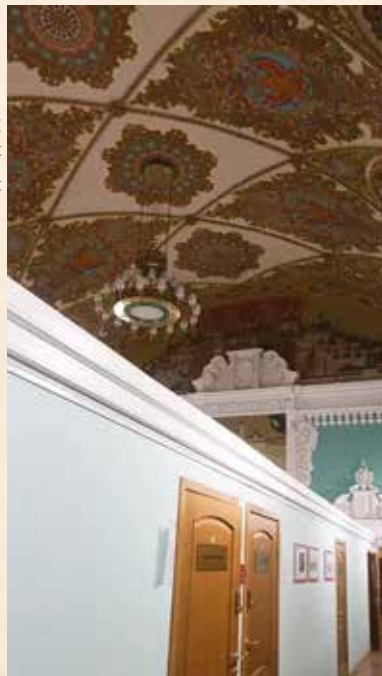
фото: Надежда Дьякова / «Б.О.»

Источник: Ежегодник Императорского общества архитекторов-художников: выпуск девятый (Петроград, 1914 год)