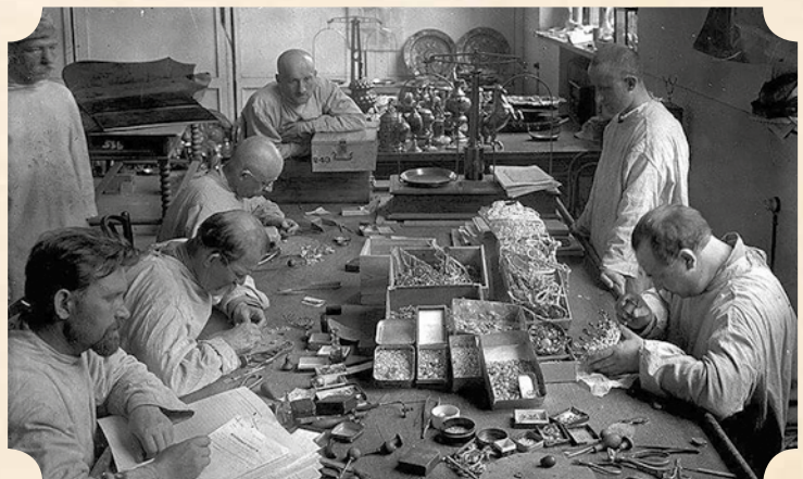
Мастера Гохрана за работой