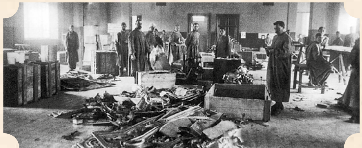
Церковное серебро в кладовых Гохрана в здании Ссудной казны. Предположительно 1921-1922 годы

Система безопасности здания считалась лучшей в стране. Размещенные здесь кладовые использовались частично Гохраном, частично Государственным банком. Еще в 1930-е годы помимо Госбанка в Ссудной казне получили в пользование помещения около десяти организаций. Вплоть до 1970-х годов масштабные ремонтные работы в здании не проводились. Лишь в 1974-м здание Ссудной казны было включено в список памятников культуры, а в 1995 году президент России Борис Ельцин присвоил ему статус памятника архитектуры федерального значения. В настоящее время единоличным владельцем здания является Центральный банк Российской Федерации.