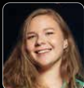
Текст ДАРИЯ НОВИКОВА, ОБОЗРЕВАТЕЛЬ «Б.О»

Фондовый рынок — живой организм. Ежесекундно обновляются «стаканы», котировки отскакивают от молниеносных новостей, а «медведи» сменяются «быками», пока биржи наполняют «хомяки». «Б.О» решил выяснить, в каких условиях сотрудники инвесткомпаний приводят в движение этот параллельный мир. Свои островки отдыха и комнаты перезагрузки в офисах показали «Цифра брокер», «ВЕЛЕС Капитал» и «Финам»